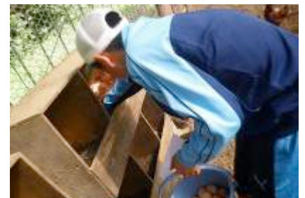
↑丁寧な鶏の下から卵をとりだします。