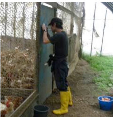
↑たまごをとりおえると、個数をメモして、大きな声で「たまご〇個ありがとう！」

わたしはたまごとりではじめてとるのがたいへんおぼかしかったです。にもとりにつかれてはたいとまもあります。にもとりがけんかをしてりてかたの上にはつめてたすけをもとめてくるとりもいます。ばあばあしてりるたまごかたまごにあつておもしろいとおもいました。